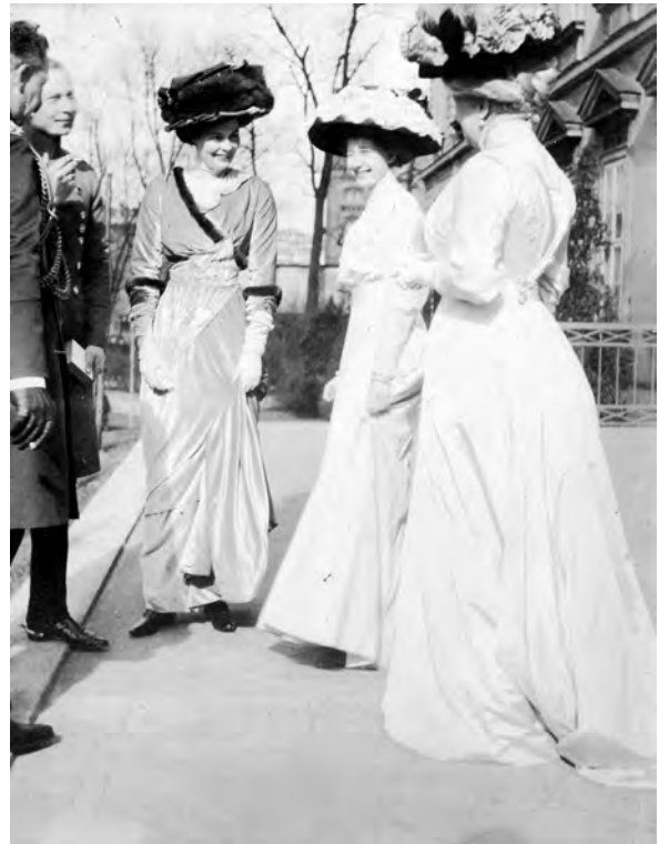
Mitglieder der kaiserlichen Familie auf der Terrasse des Schlosses Bellevue in Berlin, Ostern 1910

Das Kaiserpaar machte sich frühzeitig Gedanken über die künftigen Ehepartner seiner Kinder. Während für den Kaiser in erster Linie dynastische Interessen wichtig waren, legte die Kaiserin besonderen Wert darauf, dass ihre Kinder möglichst rein, also unberührt von Erlebnissen mit anderen Partnern, in die Ehe treten sollten. Die Ehefrauen wurden gezielt ausgesucht, dabei spielte ihre standesgemäße Herkunft die Hauptrolle. In den engeren Kreis der Gemahlinnen kamen damit nur Prinzessinnen aus regierenden europäischen oder deutschen Fürstentümern sowie Mitglieder der standesherrlichen Familien. Dabei spielte die eheliche Zuneigung eine nur untergeordnete Rolle. Das hatte zur Folge, dass die künstlich arrangierten Ehen, wie die der Kaisersöhne Eitel Friedrich, August Wilhelm und Joachim, von Beginn an unglücklich waren. Nur die Institution der Monarchie hielt die Ehen nach außen hin künstlich zusammen, da Wilhelm II. – zum einen als Deutscher Kaiser, zum anderen als Familienoberhaupt – keine privaten Skandale oder sogar Scheidungen in seinem Haus geduldet hätte. Anders sah dies nach dem Zusammenbruch der Monarchie aus. Der Kaiser hatte nicht nur seine politische Macht verloren und den