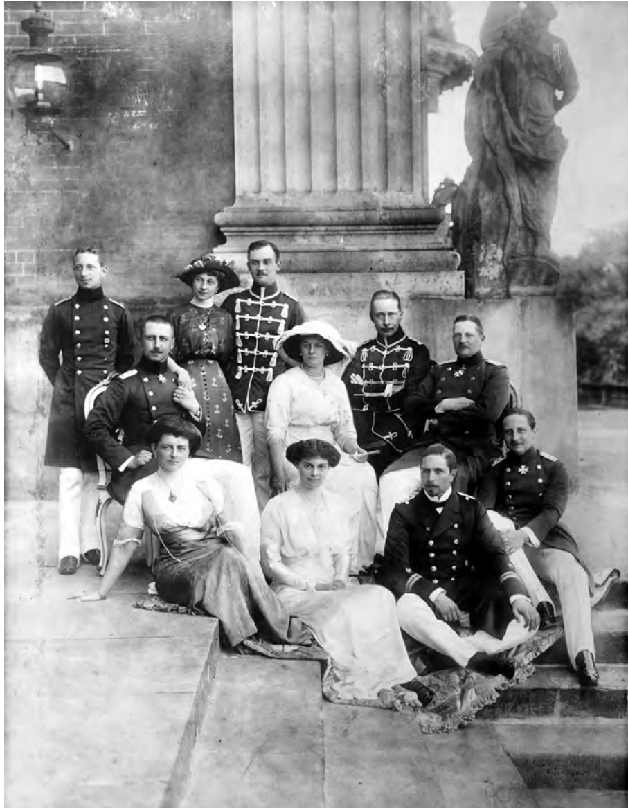
Die Kinder und Schwiegerkinder Wilhelms II. vor dem Neuen Palais in Potsdam, Juni 1913

Die Kinder und Schwiegerkinder des Kaisers posieren auf den Stufen der kaiserlichen Familienresidenz für ein Gruppenfoto. Sie geben sich bewusst locker, um im Jahr des silbernen Regierungsjubiläums des Kaisers eine gewisse Volksnähe zu bekunden. Da Kronprinz Wilhelm am Tag der Aufnahme nicht anwesend war, seine Person jedoch nicht fehlen durfte, wurde der Kaisersohn nachträglich in das Foto hinein montiert.