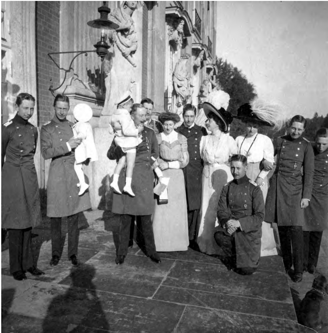
Die kaiserliche Familie auf der Rampe des Neuen Palais in Potsdam, 22. Oktober 1909 Am Geburtstag der Kaiserin hat sich die Hohenzollernfamilie für ein Gruppenfoto auf der Gartenseite des Neuen Palais versammelt. Auguste Victoria, deren Schatten unten links zu erkennen ist, fungiert selbst als Fotografin. v. l.: Joachim, Kronprinz Wilhelm mit Louis Ferdinand, Wilhelm II. mit Enkel Wilhelm, Eitel Friedrich, Victoria Luise, Adalbert, Sophie Charlotte, Alexandra Victoria, davor Oskar, August Wilhelm, Georg von Griechenland.