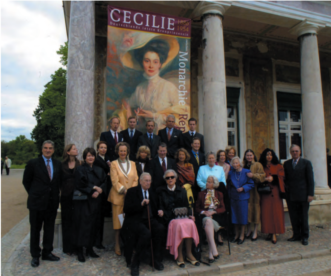
Mitglieder des ehemaligen preußischen Königshauses am Tag der Ausstellungseröffnung »Cecilie – Deutschlands letzte Kronprinzessin zwischen Monarchie und Republik« vor dem Marmorpalais in Potsdam am 8. Mai 2004.