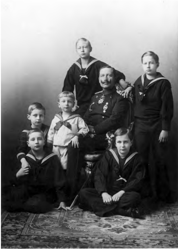
Kaiser Wilhelm II. mit seinen sechs Söhnen, 1896 v. l.: August Wilhelm, dahinter Oskar, Joachim, Eitel Friedrich, Adalbert, hinter Wilhelm II., Kronprinz Wilhelm

zur »Erhaltung der Würde und des Glanzes der Krone gewidmet« worden. Dafür musste das Königshaus für den Unterhalt der Schlösser aufkommen.