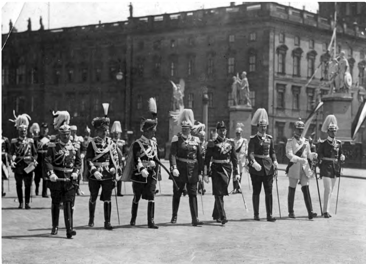
Kaiser Wilhelm II. begibt sich am Tag seines 25. Regierungsjubiläums mit seinem Schwiegersohn und seinen Söhnen zur Paroleausgabe ins Zeughaus, Berlin, 16. Juni 1913

v. l.: Wilhelm II., Herzog Ernst August zu Braunschweig u. Lüneburg (ab November 1913 regierender Herzog von Braunschweig), Kronprinz Wilhelm, Eitel Friedrich, Adalbert, August Wilhelm, Oskar, Joachim