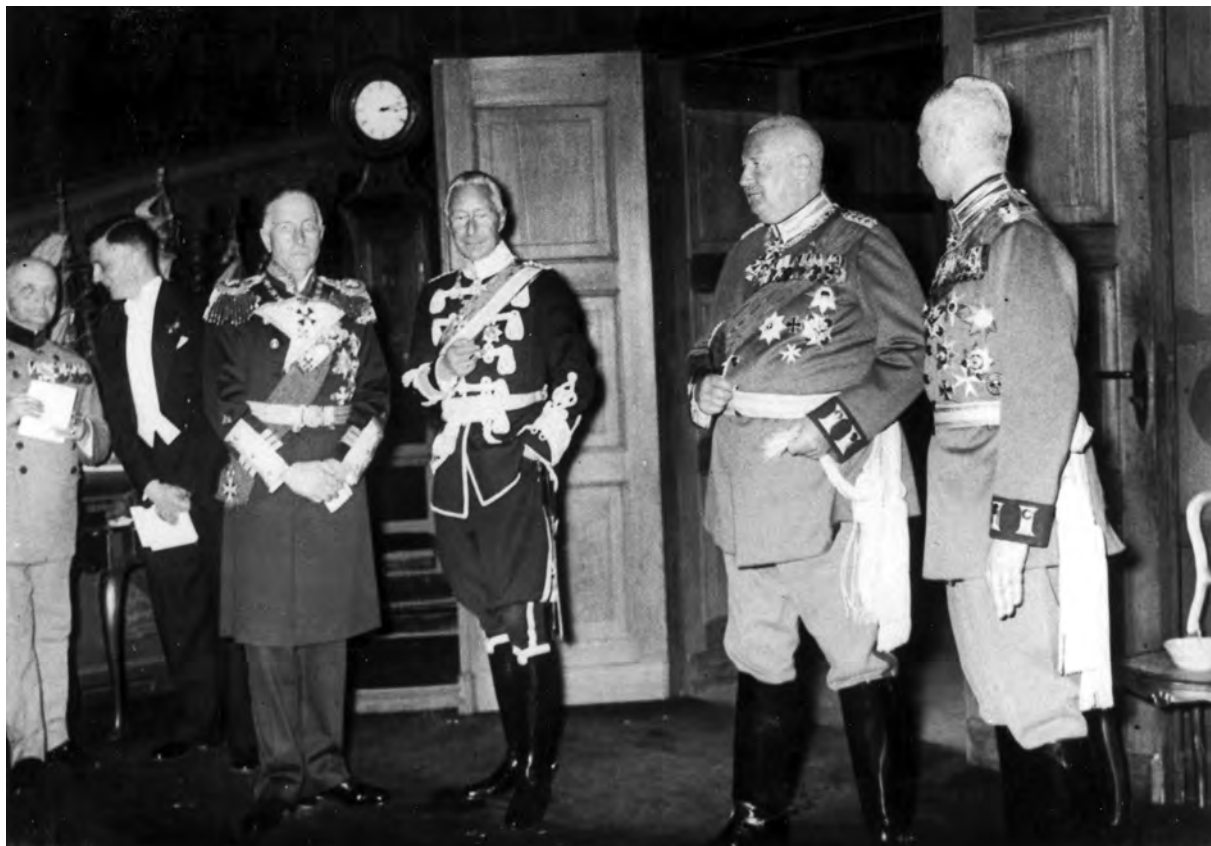
Vier Söhne des ehemaligen Kaisers, Potsdam, 2. Mai 1938

Die Söhne Wilhelms II. sind auf Einladung des Kronprinzen nach Potsdam gekommen, um die Hochzeit des Prinzen Louis Ferdinand zu feiern. Die Momentaufnahme entstand in der großen Halle des Schlosses Cecilienhof im Anschluss an die russisch-orthodoxe Trauung des zukünftigen Hohenzollernchefs.