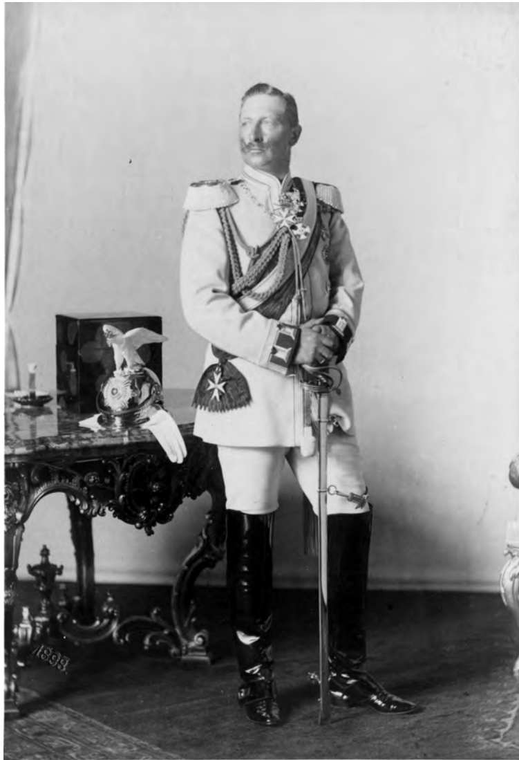
Kaiser Wilhelm II. in der Uniform der Garde du Corps, 1898 Die Aufnahme entstand aus Anlass des 10. Regierungsjubiläums Wilhelms II.